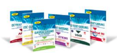
Abridged Pocket version