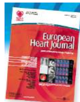
Full Text Journal version