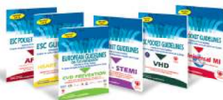
Abridged Pocket version

Za više informacija: www.escardio.org/guidelines