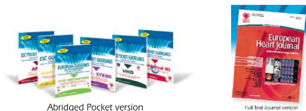
Abridged Pocket version