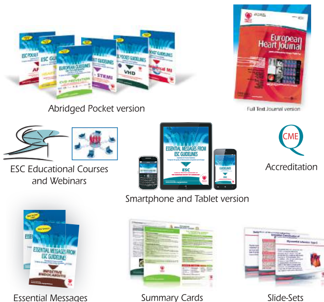
Abridged Pocket version

ESC nije odgovoran u slučaju kontradikcije, diskrepance i / ili dvosmislenosti između ESC vodiča i drugih preporuka ili vodiča izdatih od relevantnih zdravstvenih autoriteta, posebno u vezi sa dobrom dobru upotrebe zdravstvene njege ili terapijskih strategija. Zdravstveni radnici su ohrabreni da ESC Vodiče uzmu u potpunosti u obzir kada vježbanje njihovih kliničkih procjena kao i u odluci i implementaciji preventivnih, dijagnostičkih, i terapijskih strategija. Međutim, ESC Vodiči ne nadjačavaju na bilo koji način individualnu odgovornost zdravstvenih radnika da prave odgovarajuće i precizne odluke o stanju svakog pacijenta posebno i u konsultaciji sa pacijentom ili pacijentovim njegovateljom kada je to prikladno i / ili neophodno. ESC Vodiči ne oslobađaju zdravstvene profesionalce o praćenju i razmatranju relevantnih oficijalnih novih preporuka ili vodiča izdatih od kompetentne zdravstvene ustanove u cilju menadžmenta svakog pacijentovog slučaja u svjetlu naučno prihvaćenih podataka prema njihovim etičkim i profesionalnim obavezama. Takođe je odgovornost zdravstvenog profesionalca da verificira primjenjiva pravila i regulacije prema lijekovima i medicinskim uređajima u vremenu propisivanja.